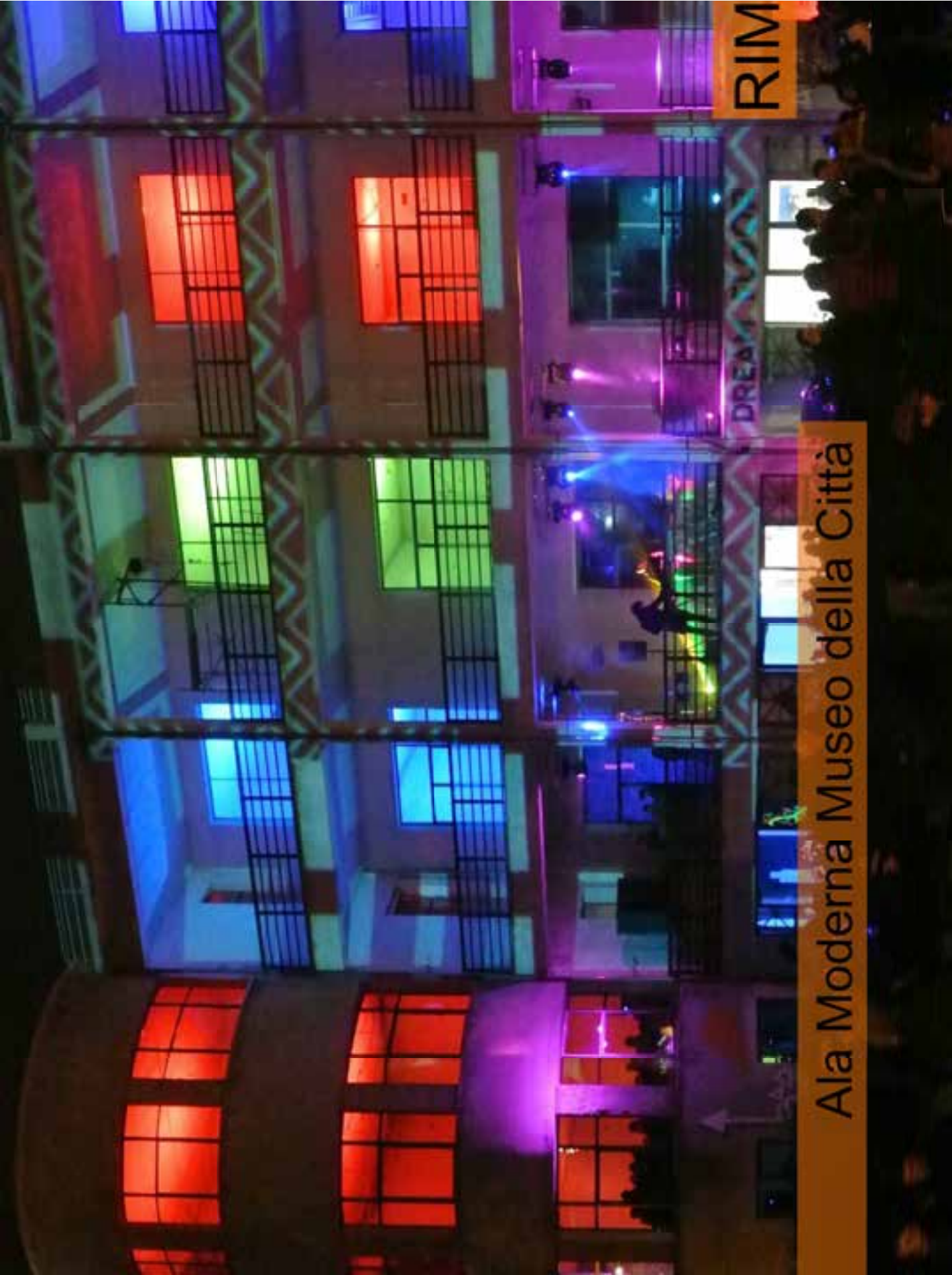
Ala Moderna Museo della Città