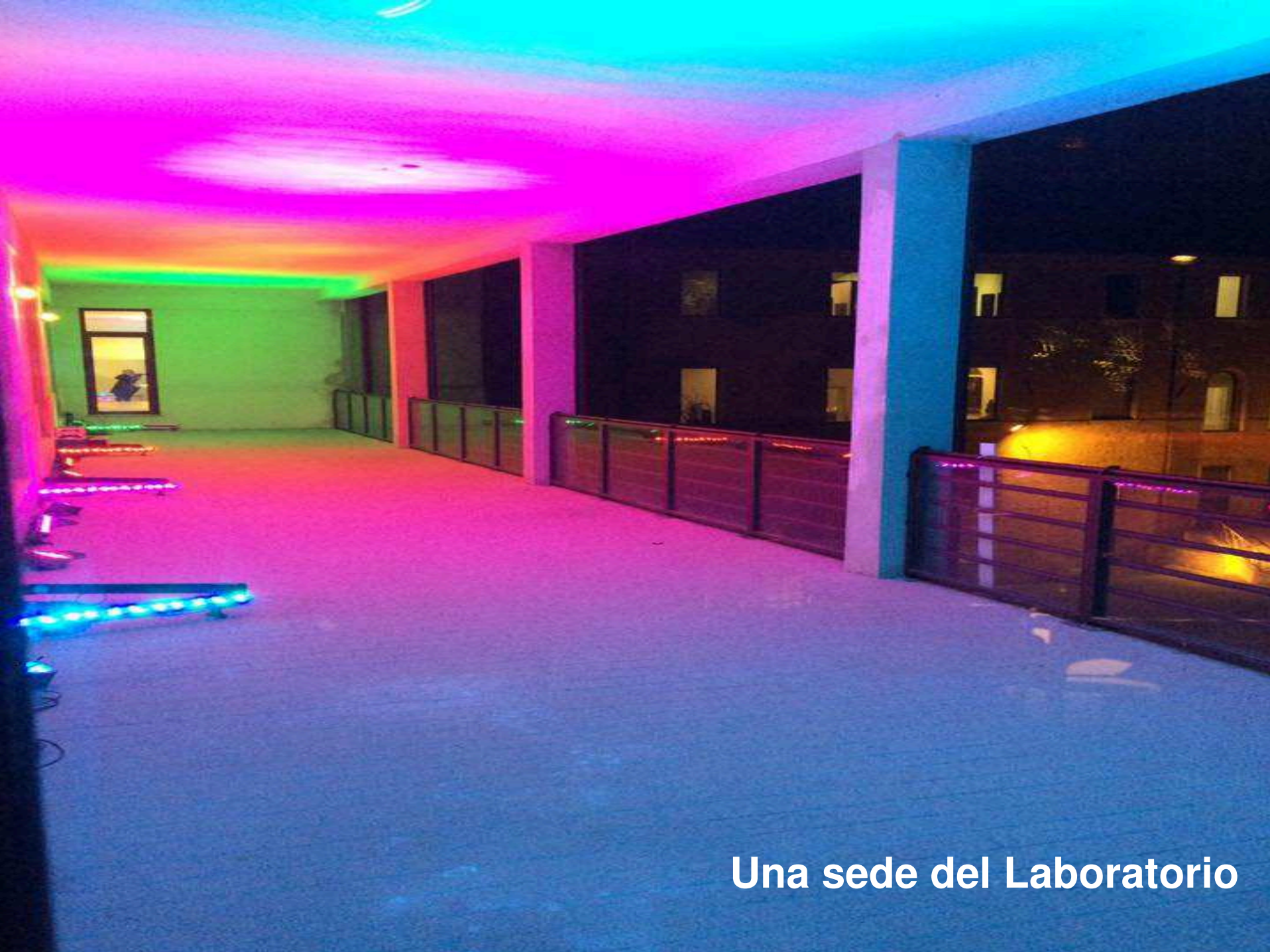
Una sede del Laboratorio