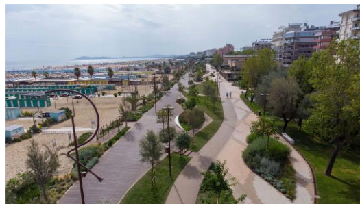
riqualificazione ambientale del waterfront della costa e di rinaturalizzazione di settori delle zone costiere