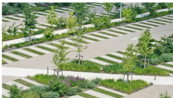
piazze minerali permeabili alberate, parcheggi verdi, parcheggi alberati