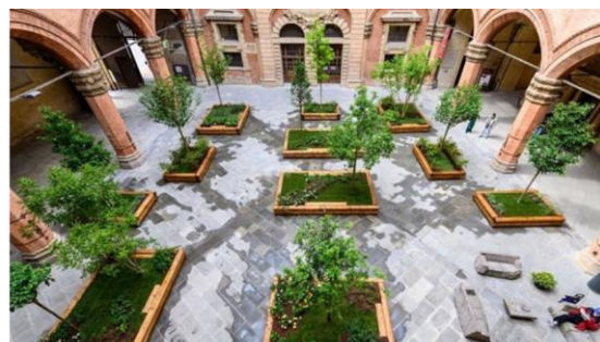
giardini rocciosi, giardini tascabili (pocket gardens) e zone verdi nelle corti interne