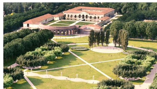
giardini e parchi di interesse artistico, storico, paesaggistico vincolati ai sensi del D.Lgs 42/2004 e s.m.i o non tutelati