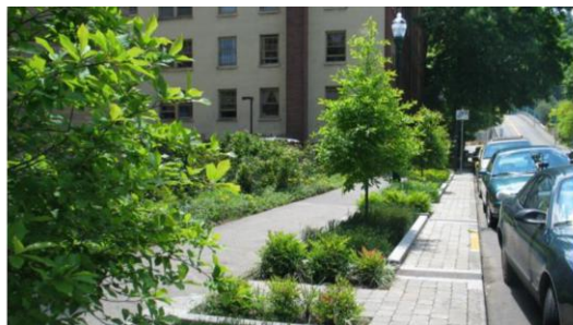
giardini della pioggia; trincee infiltranti, fossati inondabili, bacini, parchi, piazze inondabili; acqua lungo i percorsi pedonali e ciclabili; apertura di corsi d'acqua sepolti e loro ripristino in condizioni più naturali