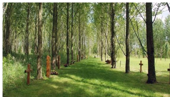
Interventi in aree cimiteriali di realizzazione di boschi / realizzazione di prati, comprese le attività di desealing - depaving