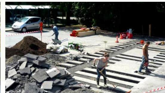
desealing-depaving e creazione di pavimentazioni drenanti con funzioni di impianto di nuove alberature