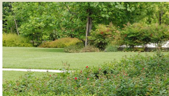
realizzazione di verde attrezzato o di miglioramento e rafforzamento ecologico di verde attrezzato esistente