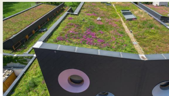
tetti verdi, giardini pensili, pergolati e verde verticale, rinverdimento delle pareti degli edifici