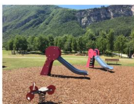
Reference progettuali: Area giochi Quartiere delle Albere, Trento