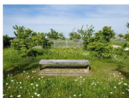
Reference progettuali: Arredi Mont-Evry Park, Parigi, Francia