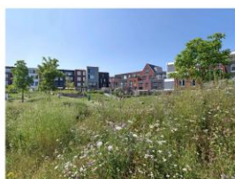
Reference progettuali: Prato fiorito Hortus Veemarkt, Utrecht, The Netherlands