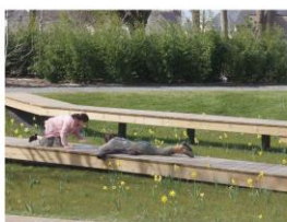
Reference progettuali: Bacini inondabili Ecoquartiere Desjardins, Angers, Francia