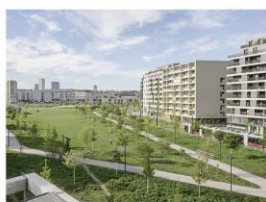
Reference progettuali: Bosco urbano Helmut-Zilk-Park, Vienna, Austria