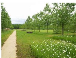
Reference progettuali: Percorsi The Natural Park of Pédouze, Francia