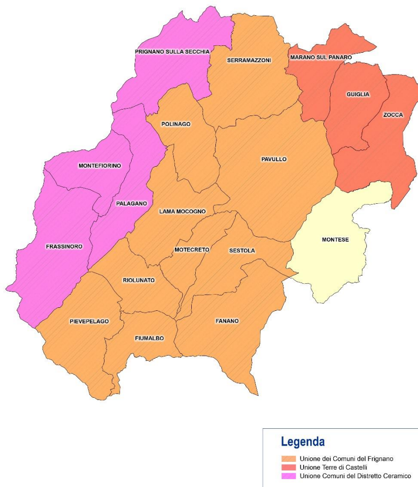
Mappa STAMI Appennino Modenese