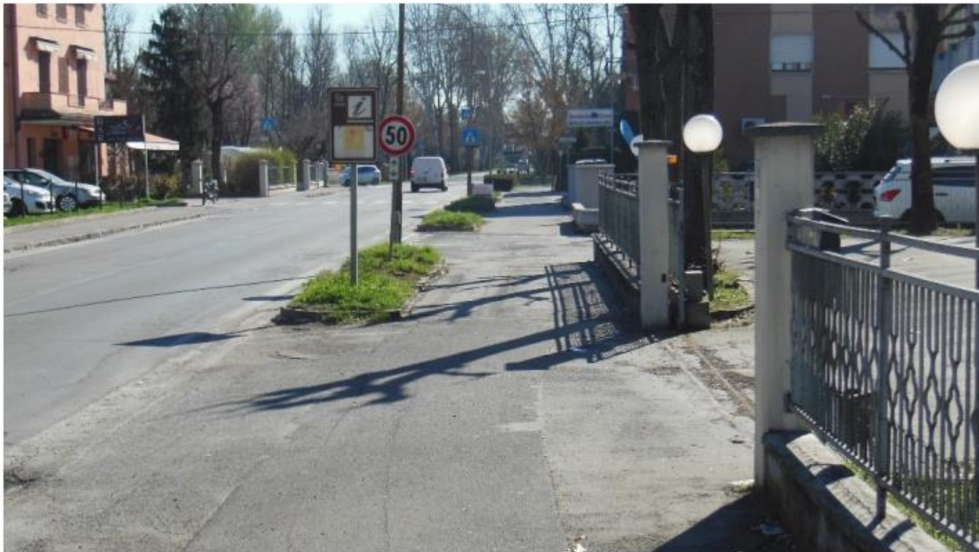
Figura 1 – Nodo 33 – via Carpi-Ravarino (SP1)